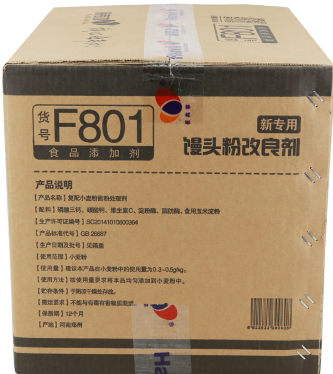
( 包装箱侧面实物照 )