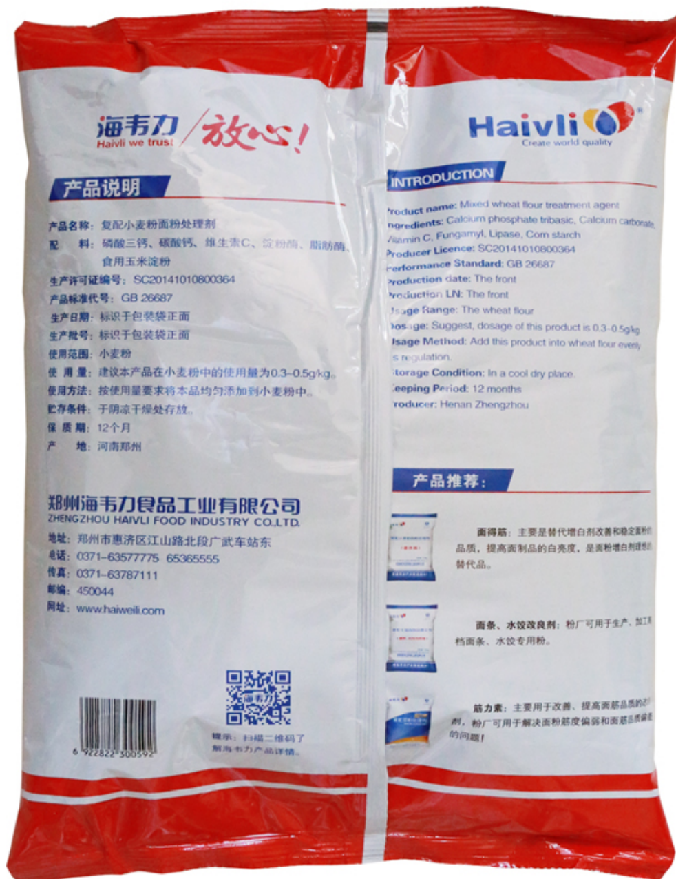
( 包装袋背面实物照 )